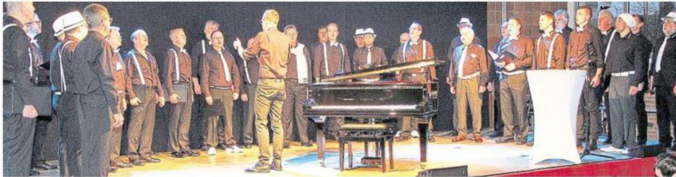
Der MGV Gackebach eröffnete am Samstagabend im Buchfinkenzentrum von Horbach mit zeitgemäßem Chorgesang die dritte Veranstaltung in der Reihe „Kabarett & Gesang im Buchfinkenland“. Als Gaststars hatten die Veranstalter das Musik-Kabarett-Duo Ass-Dur gewinnen können.